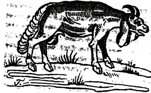
رسم رقم (٥) خروف سمين بذيل عريض وطويل وأننين طويلين للغاية

كتكوت. لذا فساكن القاهرة يأكلون الدجاج بكثرة. كما أن هناك طهاة يجهزون بسرعة لحم الجمال وهو مذاقه طيب للغاية. مما يؤكد أنه أعجبه كثيرا حين أقبل على أكلها لأول مرة في حياته، ويظهون كذلك كميات كبيرة من لحوم الضأن. والملاحظ أن تلك الخرفان لها ذيول عريضة وطويلة؛ أما آذانها، فهي طويلة للغاية. وحرص على رسم أحد الخرفان في مصنفه ليوضح شكله (١) .